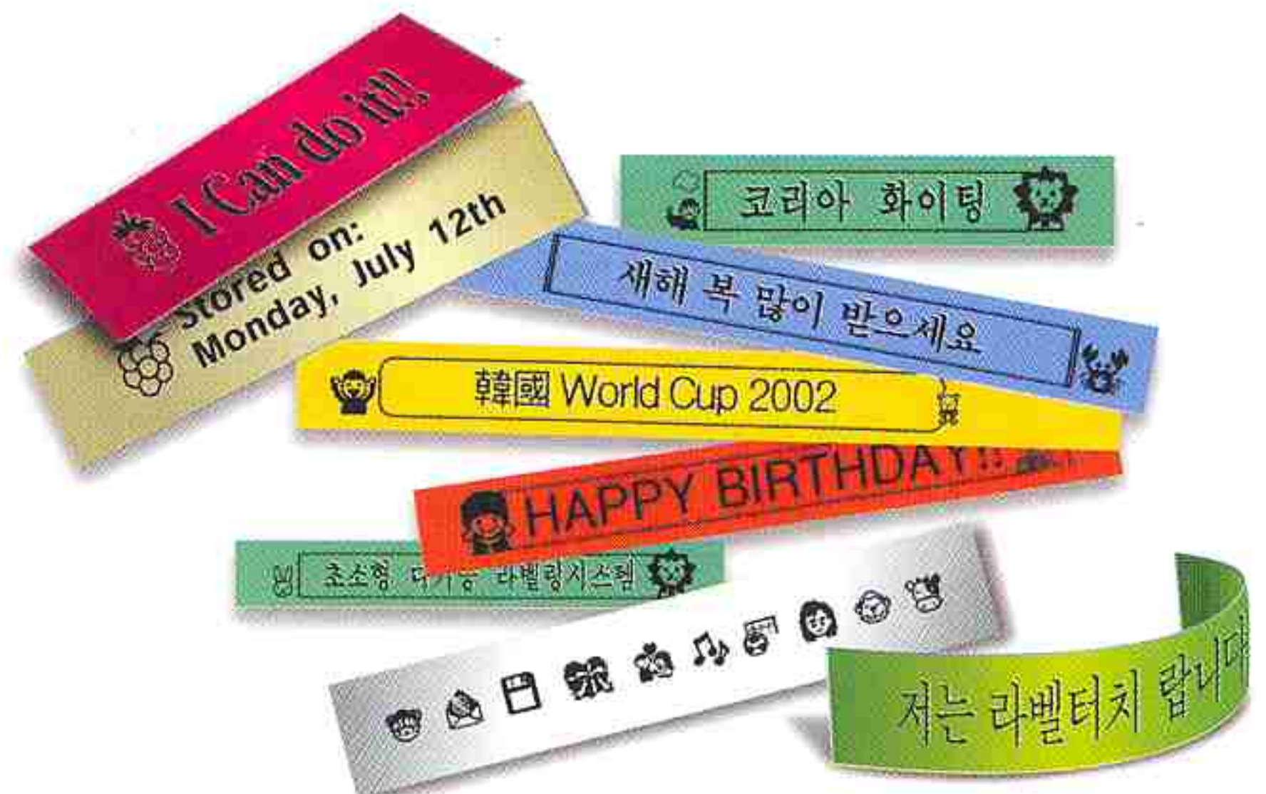
▲ 다양한 심볼 및 편집기능